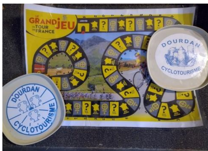
Le plateau du jeu