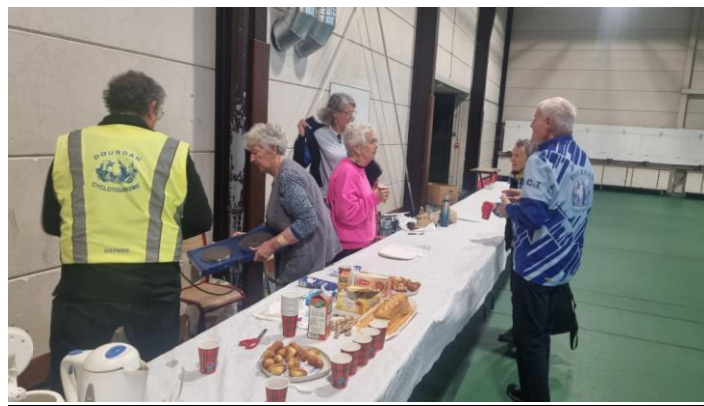
On prépare le café du matin avant les hot-dogs