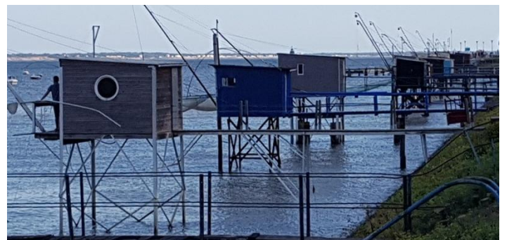
L'estuaire de la Loire près du canal de la Martinière

Nous avons d'abord longé le canal de la Martinière et puis l'estuaire de la Loire entre Le Pèlerin et Paimboeuf avec en face la zone industrielle de St Nazaire et vue sur le grand pont de St-Nazaire. Vent de face à travers les marais, puis St-Brévin-les Pins et première étape à St-Michel-Chef-Chef. Pas moyen d'acheter les fameuses galettes, beaucoup trop de monde. Je suis bien contente d'arriver.